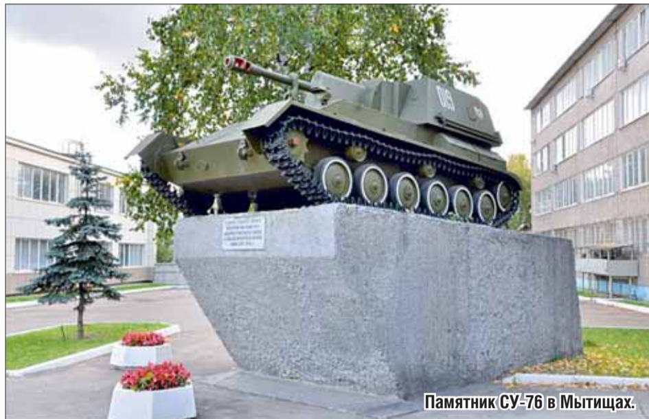
Памятник СУ-76 в Мытищах.

«В боях с немецкими захватчиками проявил себя смелым и мужественным бойцом. В районе Ландсберг неоднократно водил в бой свою